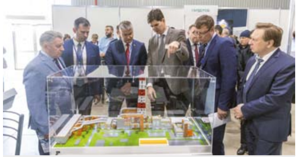
Гости ВИЭФ знакомятся с макетом проекта серогазоочистки ЕВРАЗ ЗСМК

Проект по внедрению технологии конечного охлаждения коксового газа в закрытой теплообменной аппаратуре предполагает исключение выбросов в атмосферу вредных веществ коксохимического производства в объеме около 1 тыс. тонн в год. Здесь уже смонтированы новые