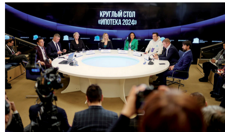
КРУГЛЫЙ СТОЛ «ИПОТЕКА 2024»

Ещё один важный момент, на который стоит обратить внимание – срок действия программ льготной ипотеки, который заканчивается 1 июля 2024 года. И самое главное, неизвестно – будет ли он продлен и на каких условиях. СЗ «Проград», несмотря на текущую ситуацию закручивания гаек на рынке недвижимости, идёт на встречу своим клиентам, стараясь сохранить стоимость квадратных метров. Поэтому компания активно взаимодействует со всеми банками, которые предоставляют выгодные условия кредитования. Также советует присмотреться к