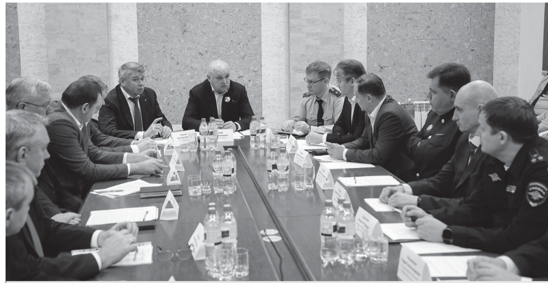
24 января губернатор Кузбасса Сергей Цивилев провел совещание в Калтане по работе Южно-Кузбасской ГРЭС

Южно-Кузбасской ГРЭС нередко предъявлялись претензии и со стороны населения, и со стороны надзорных органов. В июле 2021 года Ростехнадзор проводил внеплановую выездную проверку станции, выявил 98 нарушений промышленной и энергетической безопасности на предприятии, установив, что не проводилась экспертиза промышленной безопасности железобетонной дымовой трубы и несущих металлических конструкций всех одиннадцати котлов станции, на них было выявлено разрушение обмуровочного слоя, в рабочую зону вылетала пыль и зола и др. По результатам