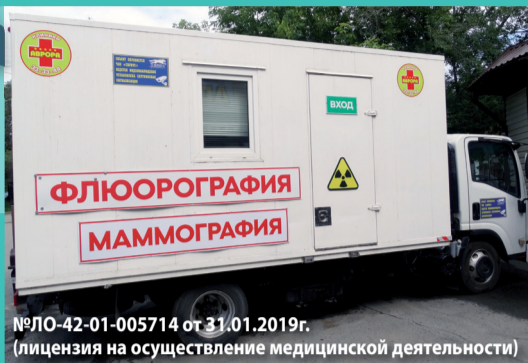
№ЛО-42-01-005714 от 31.01.2019г. (лицензия на осуществление медицинской деятельности)

флюорография; анализы; все специалисты, включая психиатра, нарколога; тестирование на наркотики; отдельно для организаций предлагаем психиатрическое освидетельствование комиссией их трёх психиатров.