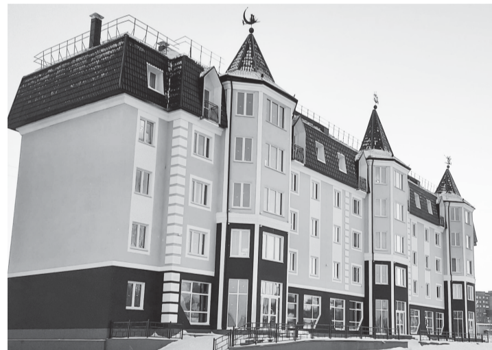
ООО «СЗ «Стройпроект» уже реализующее в Юрге проект застройки 2-го микрорайона города по пр. Победы, получило право на КРТ на участке в 3,68 га, расположенном в южной части города по ул. Фестивальная.

Проекты комплексного строительства прибавилось в регионе в конце февраля, когда по результатам аукциона право на заключение договора о комплексном развитии незастроенной территории в границах 4-ого микрорайона города Юрги получило местное ООО «Специализированный застройщик «Стройпроект»». На торги была подана только одна заявка, поэтому аукционная комиссия приняла решение признать аукцион несостоявшимся и заключить договор с единственным участником торгов по стартовой цене 8,93 млн рублей.