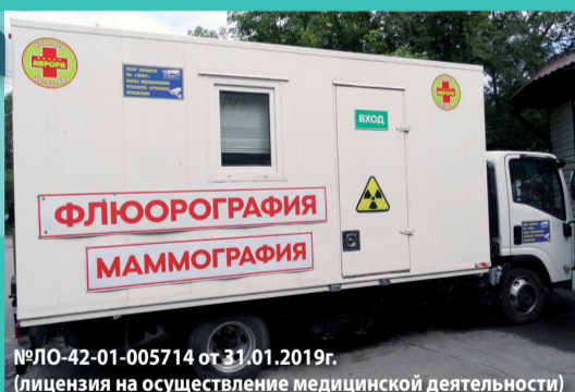
№ЛО-42-01-005714 от 31.01.2019г. (лицензия на осуществление медицинской деятельности)

флюорография; анализы; все специалисты, включая психиатра, нарколога; тестирование на наркотики; отдельно для организаций предлагаем психиатрическое освидетельствование комиссией их трёх психиатров.