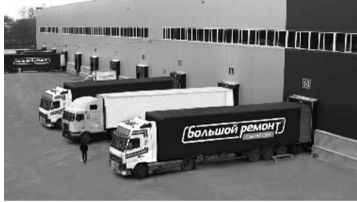
Ввод в строй распределительного центра класса «А» компанией «Стройкомплект» в 2009 году — не типичное пока событие для Кузбасса