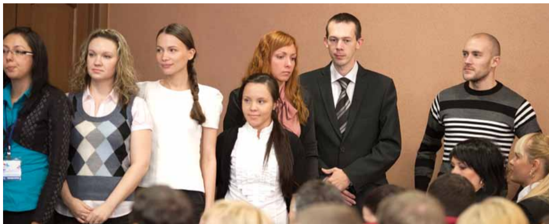
Победители конкурса лучших ответов и решений бизнес-кейсов, проводившихся в рамках проекта «Ты – Предприниматель»